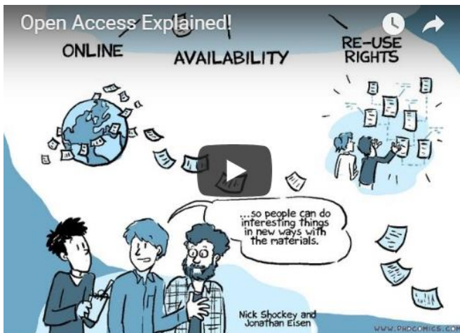
Klik op de afbeelding voor meer informatie over open access

Het meeste onderzoek wordt publiek gefinancierd en moet daarom voor het publiek vrij toegankelijk zijn. Internet biedt de mogelijkheid om 'open access' te publiceren. Nederlandse universiteiten zijn groot voorstander van open access en voeren hierover gesprekken met uitgevers.